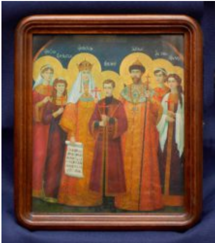
Мироточивая икона Царственных Мучеников