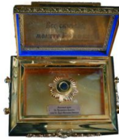
Мощевик-ларец с молочным зубиком Цесаревича Алексея

Царь умирает мученической смертью вместе с Семей, не просто как Николай Александрович, гражданин России, а именно как Помазанник Божий. Это было символическое убийство. Поэтому Церковь прославляет его за тот подвиг, который он понёс, подвиг добровольного страдания, терпения, христианского отношения к смерти. Убийство Царской Семьи — это ещё и надругательство над понятием семьи. Это был образ настоящей семьи, воспитанной в Любви, семьи, где очень трепетно относились к детям. И не случайно разрушение семьи началось тотчас же после этой страшной казни.