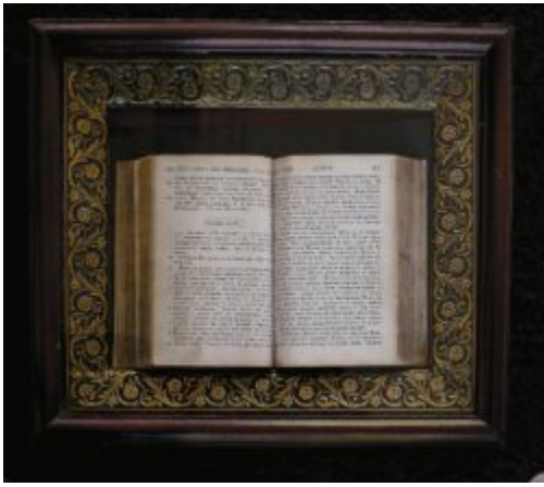
Священное Писание Царя-Страстотерпца Николая II