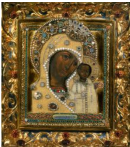
Список Казанской иконы Богородицы из Богоявленского кафедрального собора г. Москвы

Список Казанской иконы Божией Матери из Богоявленского кафедрального собора г. Москвы – одна из главных святынь программы.