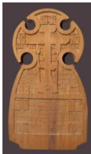
Икона Собора Бутовских новомучеников Малый Соловецкий Крест