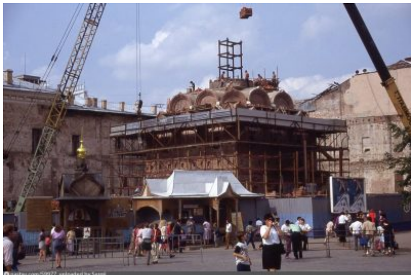
Воссоздание Казанского собора, 1992 год

Заново возведенный на средства, собранные всей православной Россией, этот храм явился зримым свидетельством пробуждения исторической памяти нашего народа. 4 ноября 1993 года Святейший Патриарх Алексий II освятил возрожденный Казанский Собор. Роспись была начата в ноябре 1996 года и производилась в строгом соответствии с описанием исторического облика Собора. Казанский собор - первый из восстановленных в Москве разрушенных в советское время святынь.