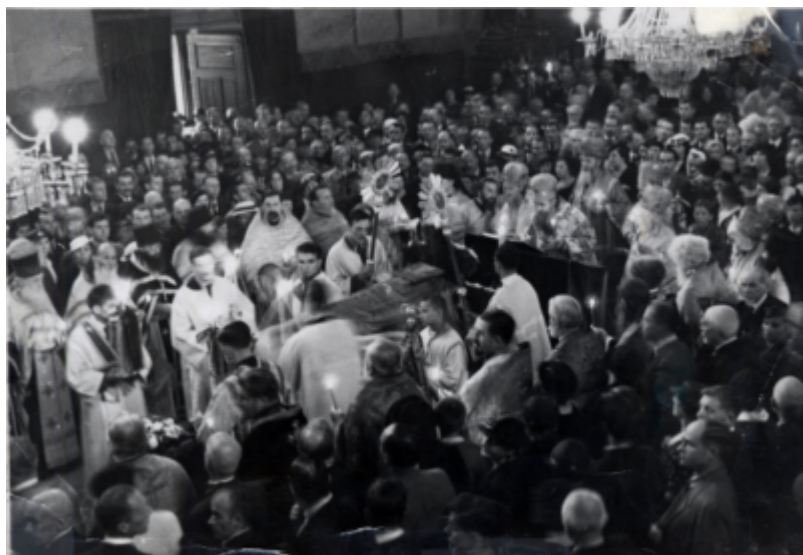
Отпевание митрополита Антония (Храповицкого) Белград, 1936 год

Разделение сохранялось и после смерти Первоиерарха Русской Зарубежной Церкви митрополита Антония (Храповицкого), последовавшей в 1936 году. Преемниками митрополита Антония на посту Председателя Архиерейского Синода Русской Зарубежной Церкви были митрополиты Анастасий (Грибановский, 1936-1964), Филарет (Вознесенский, 1964-1985), Виталий (Устинов, 1985-2001), Лавр (Шкурла, с 2001 года).