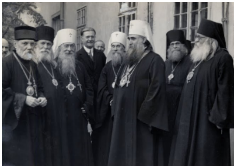
После первого заседания в патриаршем дворце в Сремских Карловцах Октябрь 1935 года

Разделение сохранялось и после смерти Первоиерарха Русской Зарубежной Церкви митрополита Антония (Храповицкого), последовавшей в 1936 году. Преемниками митрополита Антония на посту Председателя Архиерейского Синода Русской Зарубежной Церкви были митрополиты Анастасий (Грибановский, 1936-1964), Филарет (Вознесенский, 1964-1985), Виталий (Устинов, 1985-2001), Лавр (Шкурла, с 2001 года).