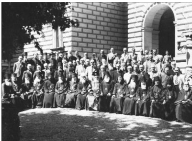
Второй Всезарубежный Собор. 1938 г.

Важную роль в жизни Русской Зарубежной Церкви играли Всезарубежные Соборы. В августе 1938 года в Сремских Карловцах состоялся II Всезарубежный Собор, в сентябре 1974 года в Свято-Троицком монастыре в Джорданвилле прошел III Всезарубежный Собор, в мае 2006 года в Сан-Франциско состоялся IV Всезарубежный Собор, принявший историческое решение о воссоединении Русской Церкви.