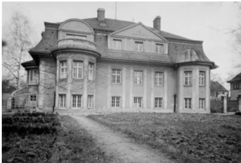
Резиденция Архиерейского Синода в Мюнхене (1946 - 1950)

В ходе Второй мировой войны Архиерейский Синод покинул Сремские Карловцы и с 1946 года находился в Мюнхене. С 1950 года Архиерейский Синод пребывает в Нью-Йорке.