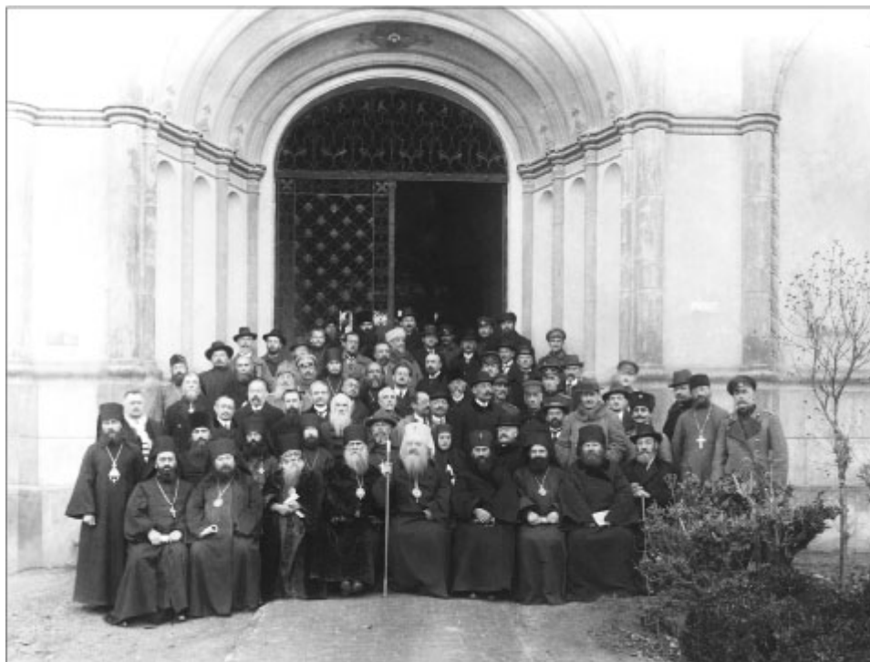
Участники Первого Всезарубежного Собора, Сремские Карловцы, Югославия, 1921. Председатель: Блаженнейший митрополит Киевский и Галицкий Антоний (Храповицкий)

Эти воззвания были использованы советской властью для обострения гонений на Церковь в России и коренным образом изменили отношения зарубежного центра с Московской Патриархией. Принятые в Карловцах документы противоречили принципу невмешательства Церкви в политические дела, ясно выраженному в Патриаршем послании от 8 октября 1919 года. «Мы с решительностью заявляем, – писал святитель Тихон, – что... установление той или иной формы правления не дело Церкви, а самого народа. Церковь не связывает себя ни с каким определенным образом правления, ибо таковое имеет лишь относительное историческое значение». Патриарх отметил, что служители Церкви «по своему сану должны стоять выше и вне всяких политических интересов, должны памятовать канонические правила Святой Церкви, коими она возбраняет своим служителям вмешиваться в политическую жизнь страны, принадлежать к каким-либо партиям, а тем более делать богослужебные обряды и священнодействия орудием политических демонстраций» [[Акты Святейшего Патриарха Тихона... С. 163-164.]].