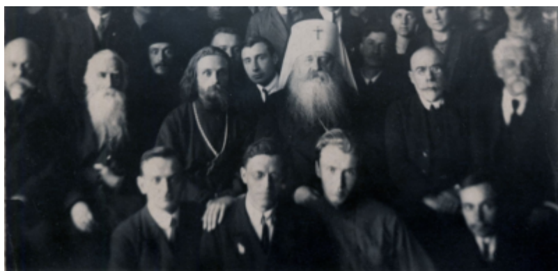
Митрополит Антоний (Храповицкий) среди русских студентов Богословского факультета Белградского университета 1924

Собор русских архиереев за границей 2 сентября 1922 года упразднил Высшее Церковное Управление в прежнем составе, однако образовал вместо него временный Архиерейский Синод во главе с митрополитом Антонием [[ Никон (Рклицкий), архиепископ . Указ. соч. Т. 7. Нью-Йорк, 1961. С. 20-21.]]. Основанием для этого решения архипастыри называли указ святителя Тихона, Священного Синода и Высшего Церковного Совета № 362 от 20 ноября 1920 года о епархиях, оказавшихся вследствие передвижения фронта или изменения государственной границы и подобных обстоятельств вне всякого общения с Высшим Церковным Управлением Русской Православной Церкви. Зарубежные архиереи сочли, что указ давал право на создание церковной организации и за пределами канонической территории Русской Православной Церкви, где ее епархий доселе не существовало. Заграничный Архиерейский Собор в июне 1923 года подтвердил решение о создании Синода.