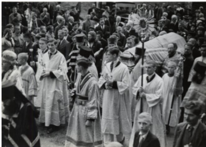
Похороны митрополита Антония Белград, 1936 год

Важную роль в жизни Русской Зарубежной Церкви играли Всезарубежные Соборы. В августе 1938 года в Сремских Карловцах состоялся II Всезарубежный Собор, в сентябре 1974 года в Свято-Троицком монастыре в Джорданвилле прошел III Всезарубежный Собор, в мае 2006 года в Сан-Франциско состоялся IV Всезарубежный Собор, принявший историческое решение о воссоединении Русской Церкви.