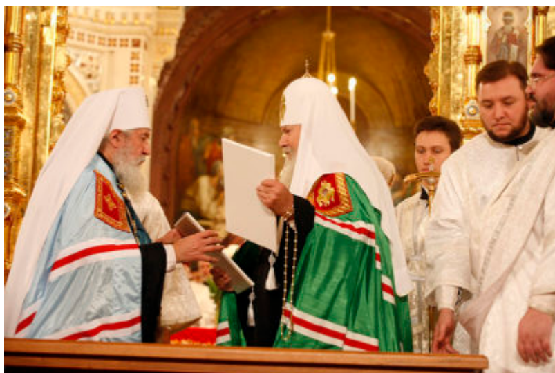
Подписание Акта о каноническом общении

Наконец, 17 мая 2007 года в Храме Христа Спасителя в Москве состоялось торжественное подписание Святейшим Патриархом Московским и всея Руси Алексием и Высокопреосвященнейшим митрополитом Лавром Акта о каноническом общении, которым восстановлено единство Московского Патриархата и Русской Зарубежной Церкви. После подписания Акта состоялось первое совместное богослужение.