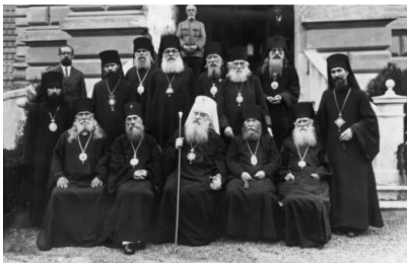
Митрополит Антоний (Храповицкий). Сремские Карловцы, 1934.

Однако осенью того же года Архиерейский Синод приостановил действие данного определения. Выступления митрополита Петра против обновленцев, его отказ участвовать в обновленческом соборе способствовали признанию заграничными архиереями полномочий будущего священномученика в качестве Патриаршего Местоблюстителя.