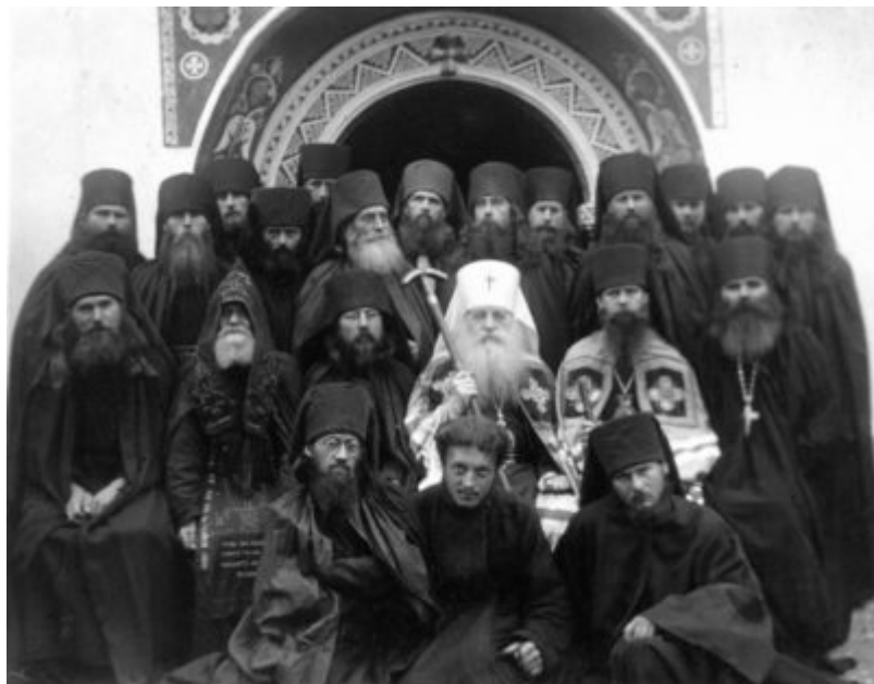
Митрополит Антоний (Храповицкий) с братией Милькова монастыря в 1926 году

Однако осенью того же года Архиерейский Синод приостановил действие данного определения. Выступления митрополита Петра против обновленцев, его отказ участвовать в обновленческом соборе способствовали признанию заграничными архиереями полномочий будущего священномученика в качестве Патриаршего Местоблюстителя.