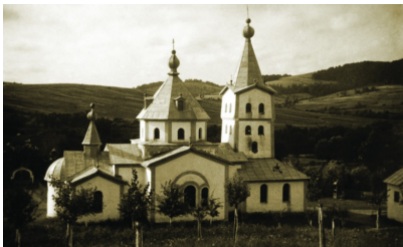
Обитель прп. Иова Почаевского

Ладомирове (Чехословакия), основанный в 1923 году. В 1946 году братия монастыря переехала в Соединенные Штаты Америки, где влилась в состав Свято-Троицкого монастыря в Джорданвилле (штат Нью-Йорк), основанного в 1930 году.