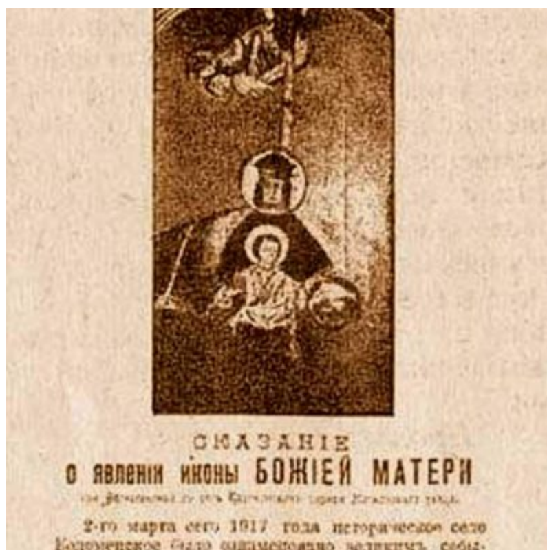
Листовка «Сказание о явлении иконы Божией Матери «Державная»-1917

В Государственном архиве Тульской области, в фонде «Тульская палата древностей», на хранении есть удивительный документ. Внешне похож на листовку и представляет собой один стандартный лист формата А4, текст на котором набран типографским способом. Как свидетельствует подстрочник - по заказу Варваринского народного Общества трезвости в Москве в типографии «Т.ва Рябушинских». Документу сто лет. Содержание, составленное современниками, невольно вызывает и сейчас душевный трепет, так как возвращает нас в начало трагических для православной России дней - отречения Государя Императора Николая II от престола и явления иконы Божией Матери «Державная».