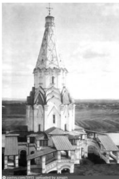
Храм Вознесения Господня в Коломенском, 20-е годы XX века

На одной стороне документа помещено «Краткое сказание о новоявленной в с. Коломенском под Москвой «Державной» Иконе Божией Матери», на второй - «Молитва Пресвятой Богородице пред чудотворною иконою Ея, именуемой «Державной».