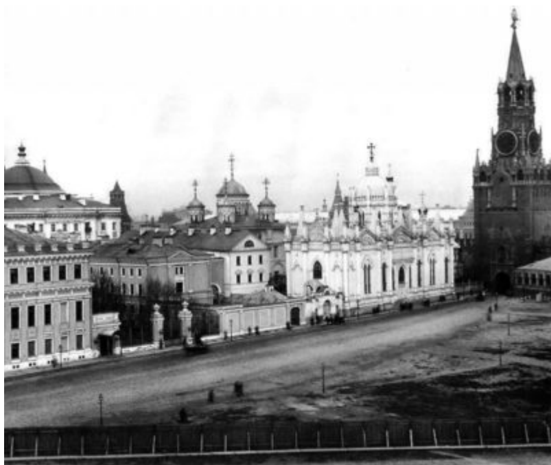
Вознесенский монастырь в Кремле

Об обретении иконы управляющий Московской епархии епископ Дмитровский Иоасаф (Каллистов) доносил митрополиту Московскому святителю Тихону (Белавину) (будущему Патриарху), а тот в донесении от 13 октября 1917 г.—Святейшему Синоду. В своем донесении митрополит Тихон писал: “По сведениям, данным членом комиссии от церковно-археологического отдела при Московском обществе любителей духовного просвещения протоиереем Страховым, икона не древняя, приблизительно конца XVIII века (не старше), по форме (вверху овальная) иконостасная, средняя, из третьего пояса (пророческого). По образу написания икона принадлежит к типу Цареградских икон Божией Матери. Икона, вероятно, осталась от иконостаса, бывшего от Вознесенской церкви ранее нынешнего”.