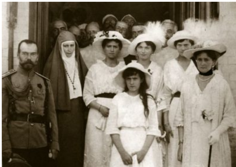
Царская семья и великая княгиня Елизавета Феодоровна

1917 г. - в самый день отречения от престола государя-императора страстотерпца царя Николая II. Всю Россию облетело известие о том, что в этот трагический день произошло чудесное явление новой иконы. В Коломенское толпами стекались богомольцы. Чтобы дать всем желающим возможность поклониться образу, его стали возить по окрестным храмам, фабрикам и заводам, оставляя в Вознесенской церкви только на воскресные и праздничные дни.