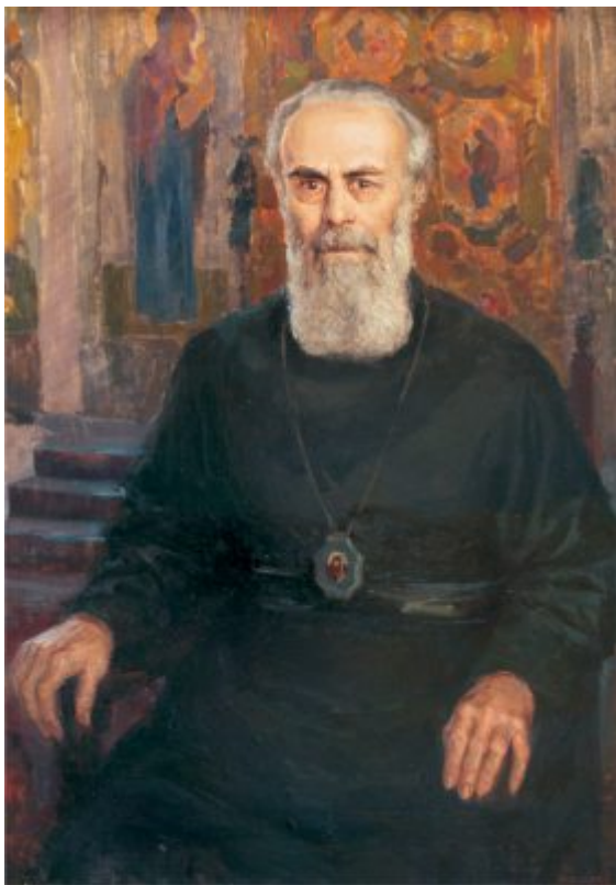
Митрополит Сурожский Антоний

И не наше, конечно, но Божие: Он-то и силен вернуть сердца к правде, лишь бы... но не стану морализировать. Проблема глубокая. Тут ведь грех не личный, а общий, при множестве искренних заблуждений, при впитывании их с молоком матери. Мы – духовные наследники наследников того поколения, которое оставило Царскую Семью на произвол «князя, господствующего в воздухе». Можно назвать его поколением предателей, но это уже будет пафос, от которого постараемся держаться в стороне. Тем более что некоторые люди переживали катастрофу 1917 года с чувством личной ответственности и глубоким покаянием, даже не будучи ответственными за происшедшее, а порою даже будучи ответственными! С этими случаями стоит познакомиться.