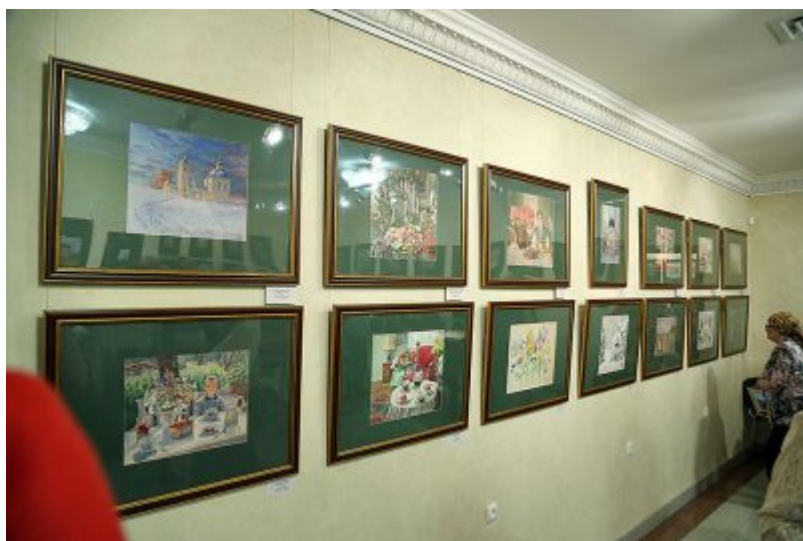
Выставка «Акварели Великой Княгини Ольги Александровны».

И мне хотелось бы поделиться рассказом об одном из самых удивительных случаев в моей жизни, показывающем, что дело хоть и нечистое, но все же небезнадежное.