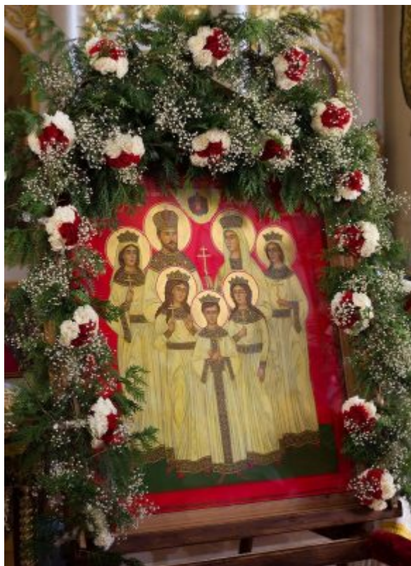
Святые царственные страстотерпцы