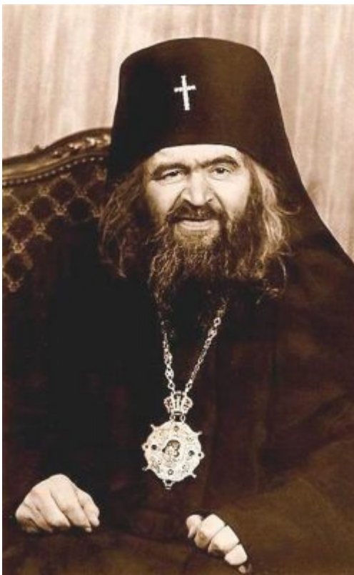
Святитель Иоанн (Максимович)