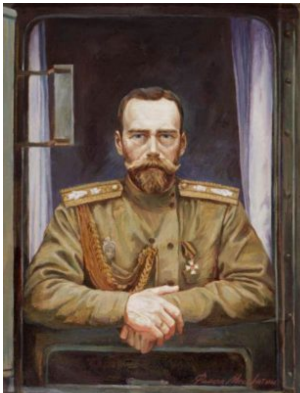
Портрет работы Филиппа Москвитина, 1999 год.

Не оказалось рядом людей, верных присяге и царю. Все выступили изменниками – от рядовых солдат питерских запасных полков до главнокомандующих фронтами, до ближайшей родни – великих князей. Никто не захотел понести с ним бремя власти, чтобы удержать Россию на краю разверзшейся пропасти.