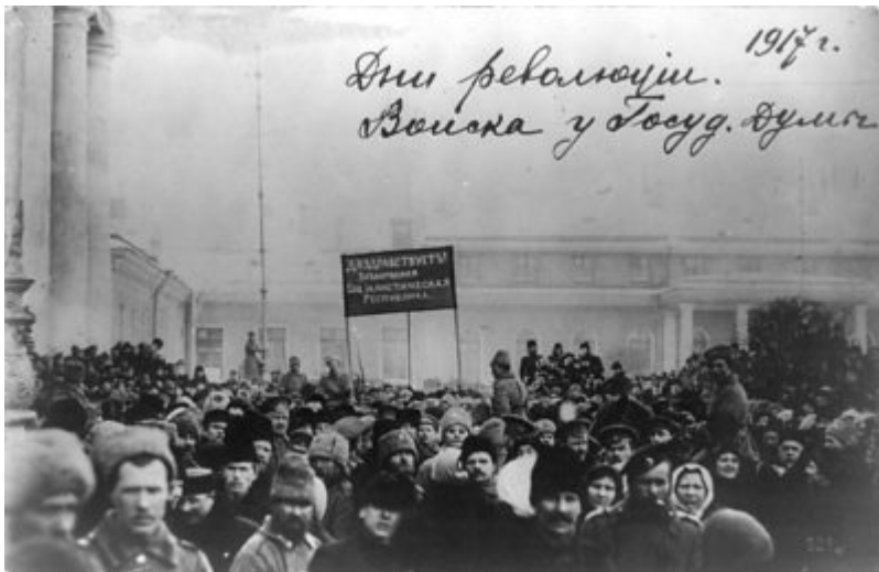
Войска у Государственной Думы

События, непосредственно связанные с отречением Николая II, начались с 14 февраля 1917 года, когда недовольные скудостью жизни военного времени толпы вышли на улицы Петрограда с лозунгами «Долой войну!», «Да здравствует республика!». Народ требовал хлеба, который преступным умыслом не подвозили в город и намеренно не продавали в лавках. Начались грабежи магазинов, погромы хлебных лавок, избивали и убивали городских. Полиция своими силами не смогла пресечь беспорядки. Начался народный бунт.