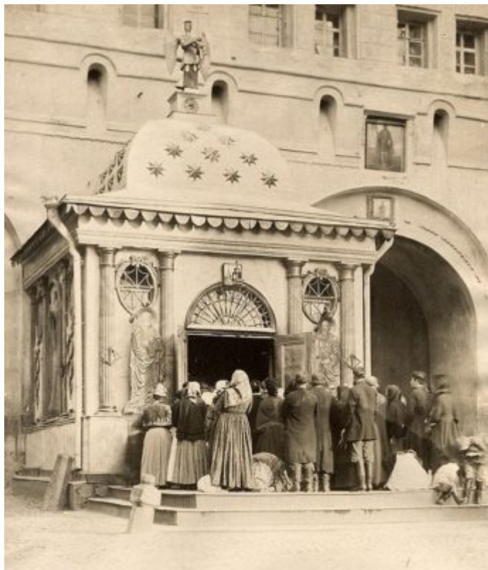
Иверская часовня у стен Московского Кремля.

По великой любви народа русского к Иверскому образу еще в середине XVII столетия принесено было в Россию несколько чтимых списков с него, из коих наиболее прославились образ в Иверском Валдайском монастыре и образ в московской часовне у Воскресенских ворот Китай-города, написанный по просьбе Патриарха Московского к архимандриту афонскому Пахомию. И когда в 1648 году три инока-святогорца поднесли царю Алексею Михайловичу готовый образ, то приложили к нему и письменное повествование: