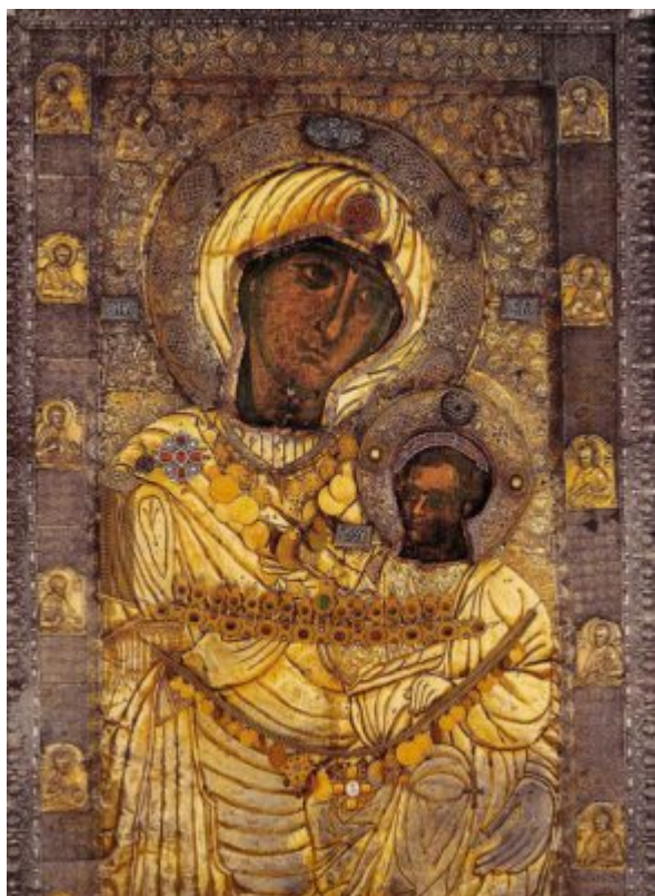
Иверская икона Божией Матери

Во вторник Светлой Седмицы совершается особое празднование в честь Иверской иконы Божией Матери. Этот праздник установлен в честь обретения чудотворного образа на горе Афон в XI веке. Иверская икона Пресвятой Богородицы, Вратарница или Привратница почитается как чудотворная, принадлежит к иконописному типу Одигитрия. Оригинал находится в Иверском монастыре на Афоне, в Греции; согласно православному преданию он написан евангелистом Лукой.