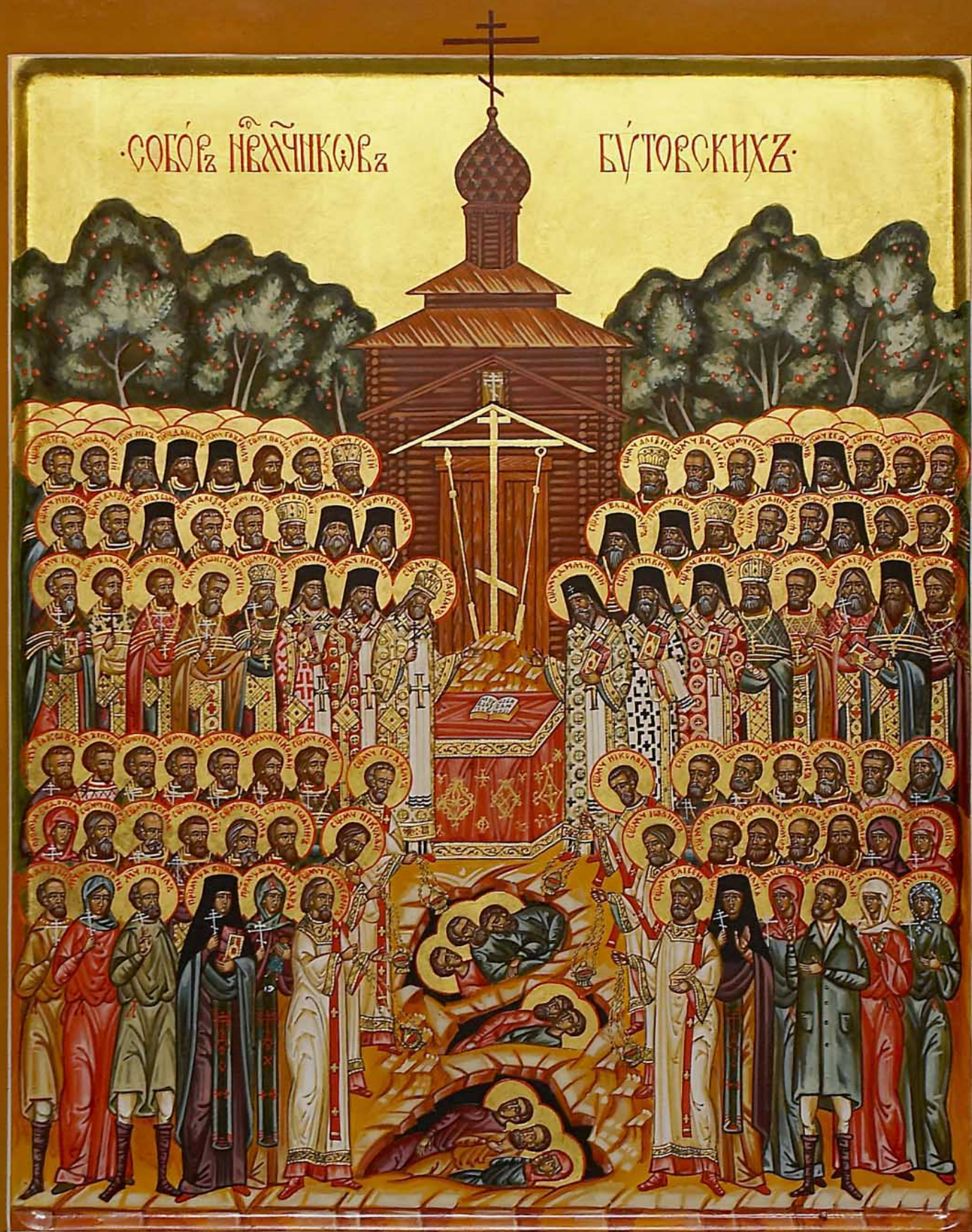
Сей образъ написанъ 6/19 мая 2004 г. въ память о бѣсѣщеніи собора стѣхъ правдниковъ и исповѣдниковъ российскихъ въ Бутовѣ.