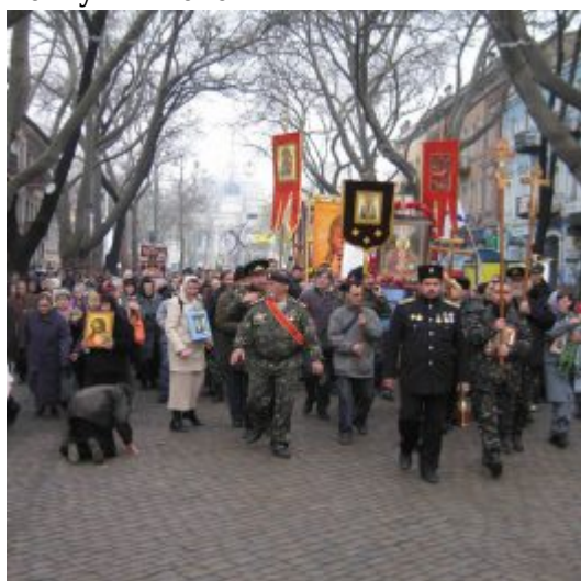
мимо Ильинского храма