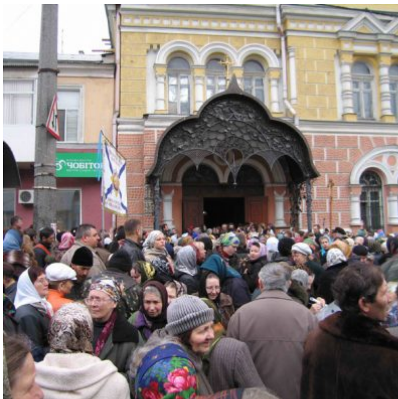
В ожидании иконы