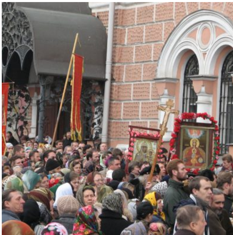
В ожидании иконы