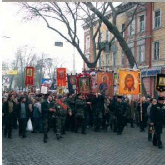
мимо Ильинского храма