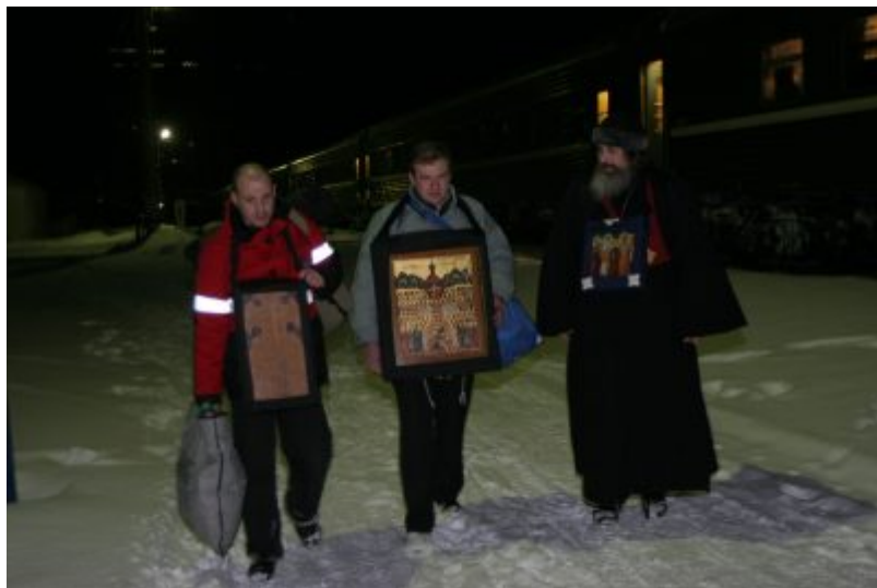
Прибытие в Верхотурье.

Ночью 29 февраля паломники из Москвы прибыли в город Верхотурье. Свято-Николаевский мужской монастырь, который они посещают здесь, – старейший на Урале.