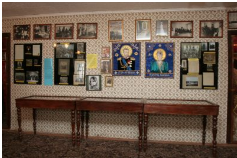
В музее Свято-Николаевского монастыря.

Когда через год освящали Симеоновский придел Крестовоздвиженского собора, в монастырь привезли царский подарок – сень для мощей святого праведного Симеона. Вся она была вызолочена и имела серебряную надпись: «Сия сень сооружена к мощам Симеона праведного в Верхотурский Николаевский монастырь иждивением и любовью Благочестивейшего Самодержавнейшего Великого Государя Императора Николая Александровича, Благочестивейшей государыни императрицы Александры Федоровны, наследника цесаревича Алексея Николаевича и Благоверных княжен Ольги, Татьяны, Марии, Анастасии Николаевен». К предполагаемому приезду в Верхотурье Царской Семьи был построен рядом с монастырем Дом почетных гостей по типу боярских хором 16 – 17 веков (сейчас в этом доме находится Краеведческий музей). Но Первая мировая война сделала эту поездку Царской Семьи невозможной. Зато в июле 1914 года паломничество по святым местам Верхотурья совершила одна из представителей Дома Романовых – Великая княгиня Елизавета Федоровна. В монастыре ей была устроена торжественная встреча. Одним из первых она посетила Крестовоздвиженский собор.