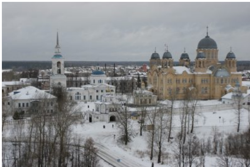
Панорама Верхотурского Свято-Николаевского монастыря с колокольни Верхотурского кремля.

В последующее время в обители были возведены три каменных храма: Свято-Никольский, Преображенский, а также храм во имя Праведного Симеона Богоприимца и Пророчицы Анны. В конце XIX века число братии и послушников в обители было уже больше сотни, а число приезжающих сюда богомольцев измерялось десятками тысяч в год. В монастыре была собрана библиотека, насчитывающая три с половиной тысячи духовных книг. Были построены каменные кузницы, проведен водопровод, действовала церковно-приходская школа.