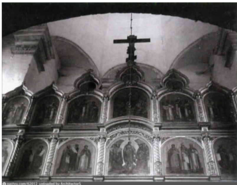
Иконостас Вознесенского храма в Коломенском

формы, со спадающей на плечи тканью черного цвета. Митрополиты и патриархи носят белые клобуки.]], в мантии, древней, слева выходит другой иеромонах, тот был в клобуке, черный с бородой, он заявил при этом: "Будет спор со старообрядцами о СЛОВЕ БОЖИЕМ", и по окончании этого он обратился ко мне, взглянув на меня, и в этот момент я обратилась к ЖЕНЩИНЕ, слезно прося ЕЯ, и сказала: "Пойдем отсюда, найдет народ и здесь будет душно". Она вмиг встала, пошла, я оглянулась назад и вижу, что иеромонах на четверть стоит в земле - тот, который стоял слева. Когда я подошла к диванчику, чтобы взять платье, в этот момент в стене образовалась брешь, куда пошла ЦАРИЦА НЕБЕСНАЯ.